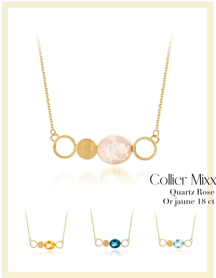
Collier Mixx Quartz Rose Or jaune 18 ct

Artisanat 100% belge Pierres naturelles Or 18 carats Personnalisable