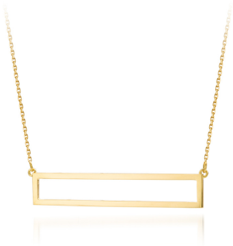
Collier Rectangle Or jaune 18 ct