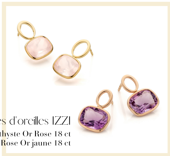
Boucles d'oreilles IZZI Améthyste Or Rose 18 ct Quartz Rose Or jaune 18 ct