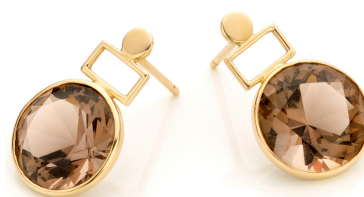
Boucles d'oreilles SOPHIE Quartz Fumé Or jaune 18 ct

Artisanat 100% belge Pierres naturelles Or 18 carats Personnalisable