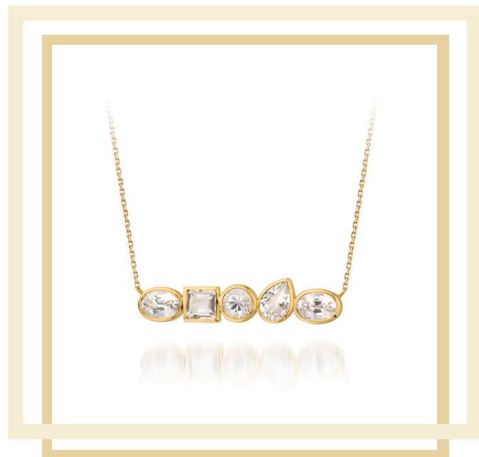
Collier Julie Topazes & Zircons naturels Or jaune 18 ct