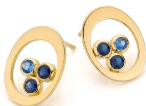
Boucles d'oreilles TRIO Saphirs Or jaune 18 ct