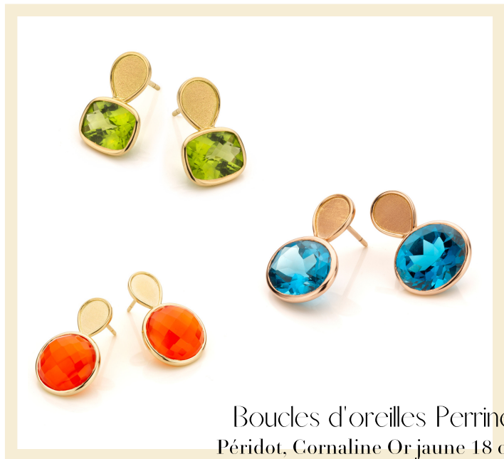
Boucles d'oreilles Perrine Péridot, Cornaline Or jaune 18 ct Topaze Blue London Or rose 18 ct