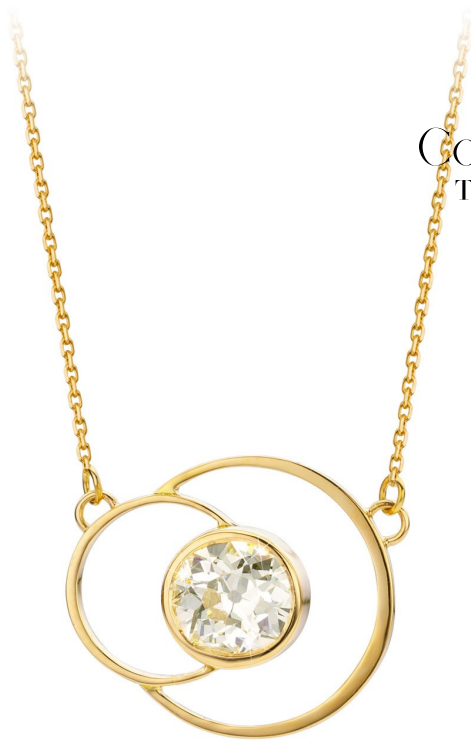
Collier Anne Topaze incolore Or jaune 18 ct

Artisanat 100% belge Pierres naturelles Or 18 carats Personnalisable