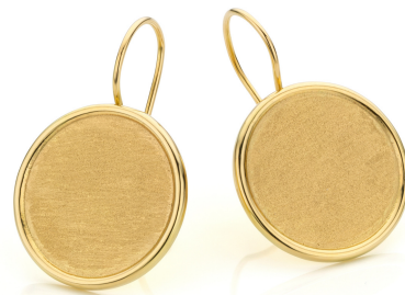
Boucles d'oreilles MOON Or jaune 18 ct, brossé.

Artisanat 100% belge Pierres naturelles Or 18 carats Personnalisable