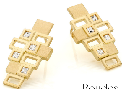
Boucles d'oreilles INCA Saphirs incolores Or jaune 18 ct