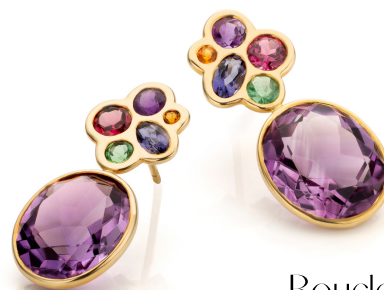
Boucles d'oreilles COLOR Améthyste & co Or jaune 18 ct